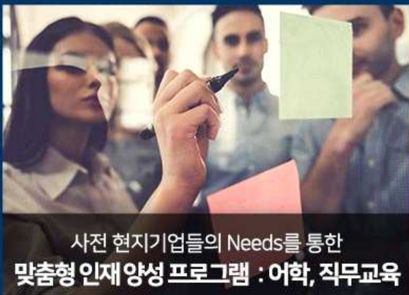
사전 현지기업들의 Needs를 통한 맞춤형 인재양성 프로그램 : 어학, 직무교육