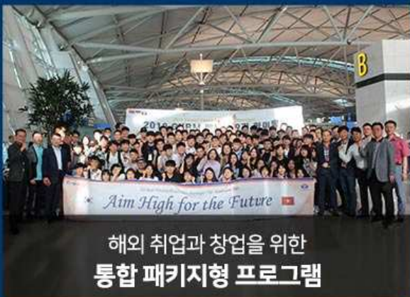
해외 취업과 창업을 위한 통합 패키지형 프로그램

선순환형 전인격적 통합 교육 프로그램 신체(體) / 행동(仁) / 의지(志)