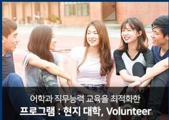
어학과 직무능력 교육을 최적화한 프로그램 : 현지 대학, Volunteer