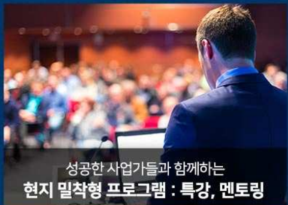
성공한 사업가들과 함께하는 현지 밀착형 프로그램 : 특강, 멘토링